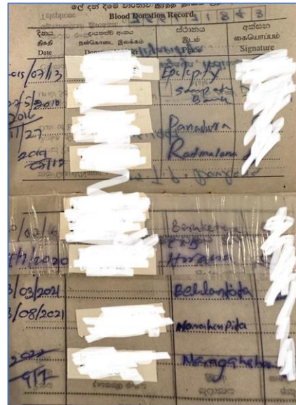
පින්තූරය 2: ෂේන්ගේ ලේ දන්දීමේ වාර්තාව

සෑම රුධිර පරිත්‍යාගශීලියෙකුටම, ජාතික රුධිර පාරවිලයන සේවය මගින්, රුධිර පරිත්‍යාගශීලීන්ගේ පොතක් ලබාදේ. එය එක් පරිත්‍යාගශීලියෙකු සඳහා තනි Barcode එකකින් සමන්විත වේ. එක් පොතක් අවසන් වූ පසු, එය පද්ධතියට එක් කිරීමට නැවත ලබා දෙන අතර, පැරණි පොත වෙනුවට නව පොතක් හිමිවෙයි. පරිත්‍යාගයක් අතරතුර, පොතේ Barcode එක Scan කර ගන්නා “පරිත්‍යාග අංකය” සහිත ස්ටිකරයක් ලබා දෙයි. සෑම පරිත්‍යාගයකටම පසු ලේ දන්දීමේ වාර්තාව වෛද්‍යවරයෙකු විසින් අත්සන් කරනු ලැබේ.